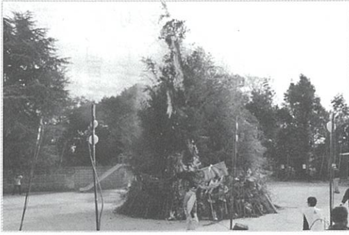
燃え始める「とんど」

とんどは午前中に地域の人達によって組み立てられました。午後1時、年男が点火しました。勢いよく燃え上がり、パチパチと竹のはじける音が折折大きく聞こえました。50分ほどで火はおさまり、参加者は合図とともに、竹竿の先につけた餅を熱さと煙に耐えながら、各々の願いを込めて焼きました。