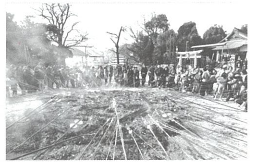
願いを込めて、竹に挟んだ餅を焼く