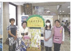
交通遺児募金の協力