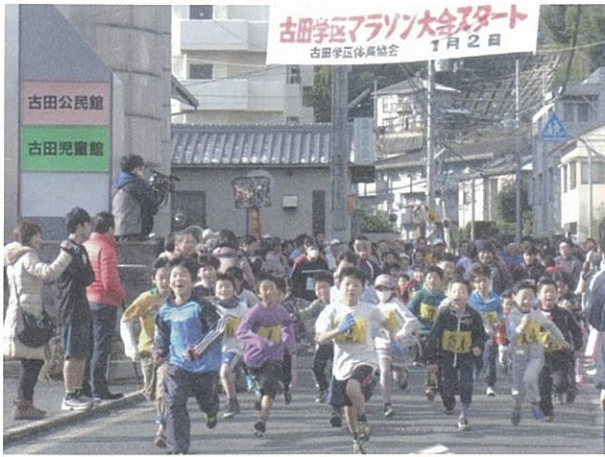
声援を受け公民館前を元気よくスタート