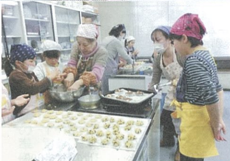
バレンタインデーのお菓子づくり 各テーブルに母親クラブのメンバーが2人ずつつきました。