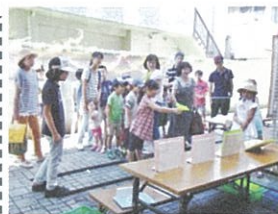
「ふれあいひろば」の児童館遊びランド