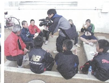
ケーブルTVのインタビューを受ける参加者

表彰式では幼児の完走者にはメダル、年齢別、男女別の優勝者には賞状とトロフィー、2 位 3 位には賞状が授与されました。