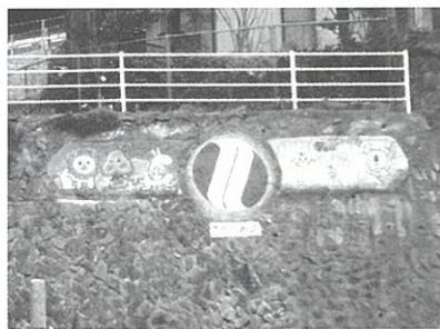
幼稚園児など小さな子どもさんに喜んでもらえるかな！

親しみやすく楽しい、「ミニユニケーション」の場としての公園づくりが進んでいます。