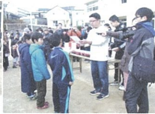
子ども会会長から表彰状