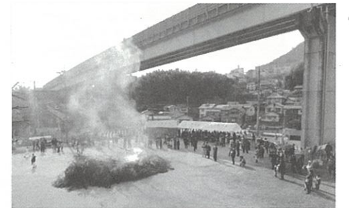
田方 高く舞い上がる「とんど」の煙